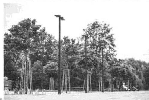
UHERSKÝ BROD, ČR