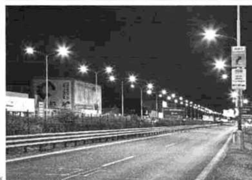
HRÁNSKÁ BYSTRICA, SK