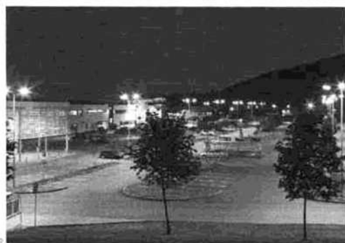
GLOBUS BRNO, ČR