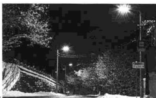
JANOV NAD NISOU, ČR

Naším cílem není strohý prodej svítidel v krabicích, ale naopak vybudování partnerského vztahu, který je založený na důvěře. Další podmínky níže v nabídce.